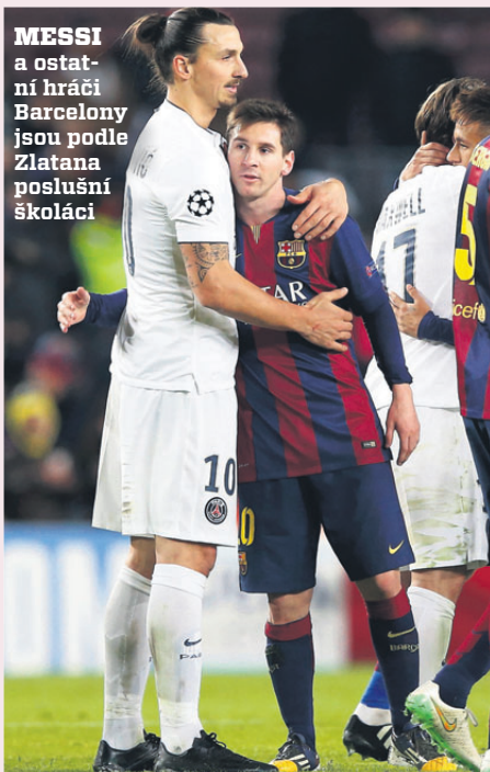
MESSI a ostatní hráči Barcelony jsou podle Zlatana poslušní školáci

V Barceloně hrál od sezony 2009. A byl šokován z toho, jak moc jsou hráči pokorní až utápnutí. „Messi, Xavi, Iniesta, ... celý tým byli jako malí školáci. Nejlepší hráči světa se sklopenými hlavami dělali všechno, co se jim v Barceloně řeklo,“ divil se Zlatan. „Prý že jsou dělníci fotbalu a nechtějí dávat na odív, že jsou něco víc než Real Madrid,“ kroutil hlavou.