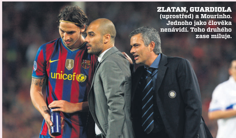
ZLATAN, GUARDIOLA (uprostřed) a Mourinho. Jednoho jako člověka nenávidí. Toho druhého zase miluje.