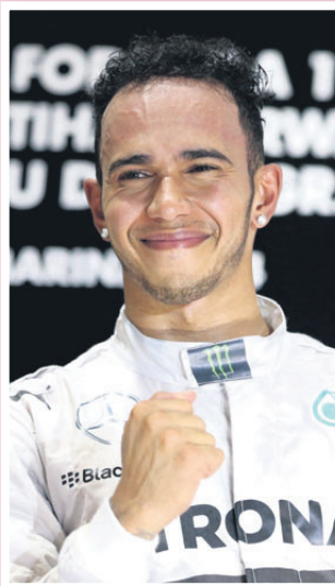
BRIT LEWIS HAMILTON letos vyhrál mistrovství světa

Stáj Mercedes se o víkend představí při Závodě šampionů na Barbadosu s dva roky starým monopostem, za jehož volant usedne při předváděcí jízdě černovlasý mladík. Ale pozor, není to Lewis Hamilton! Vůz s úžasným zvukem osmiválcového motoru bude pilotovat rezervní jezdec německé stáje Pascal Wehrlein, který jako by úřadujícímu mistru světa z oka vypadl. Pascal Wehrlein (19) je nejmladším vítězem prestižního seriálu cestovních vozů DTM a v poslední den posezonních testů F1 v Abú Zabí byl ze všech nejrychlejší. „Na závod šampionů jsem se vždycky jen díval v televizi, moc se těším. Vůz zní fantasticky a doufám, že předvedu i nějaké ty dny, aby se diváci bavili,“ řekl mladý Němec, který se představí i v nedělním Závodě šampionů v týmu mj. s devítinásobným vítězem LeMans Tomem Kristensenem. Určitě o něm ještě uslyšíme. A nejen proto, že se podobá šampionovi. (ija)