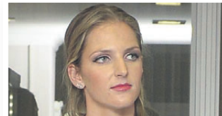
Karolína Plíšková 1:2,5